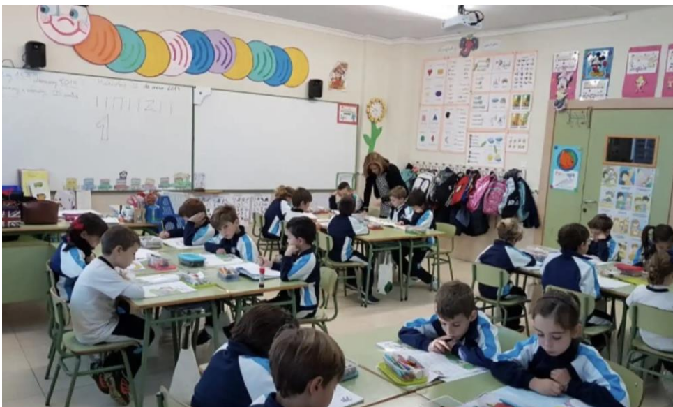
Cerrado de Calderón (Málaga)